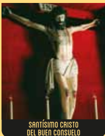
SANTÍSIMO CRISTO DEL BUEN CONSUELO

Esta imagen de Cristo Doliente, obra del escultor gallego Antón Ferreiro, data del siglo XVIII. De gran valor artístico, se conserva en la Iglesia de la Venerable Orden Tercera.