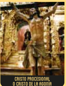
CRISTO PROCESIONAL O CRISTO DE LA AGONÍA

La talla en madera data del S. XIX y tiene origen alemán. La policromía es obra del maestro imaginero sevillano Guillermo Martínez Salazar. Representa a la Virgen al pie de la Cruz, con el Hijo en los brazos tras el Descendimiento, en actitud de sereno dolor. Este paso, que se conserva en la Iglesia de la Venerable Orden Tercera, es el paso asignado al Excmo. Ayuntamiento de A Coruña.