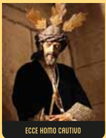
ECCE HOMO CAUTIVO

Talla en madera policromada del siglo XX, representando la entrada triunfal de Jesús en Jerusalén, a lomos de una borriquilla, entre palmas y ramos de olivo. Es el prelude de su Pasión. La imagen se conserva en la Iglesia de los PP. Capuchinos.