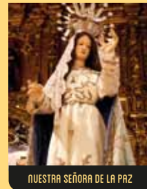
NUESTRA SEÑORA DE LA PAZ

De origen italiano, se sabe que esta talla policromada ya procesionaba en el año 1674. Pertenece a la Iglesia de la Orden Tercera, viste un manto regional típico de la alta burguesía gallega de fines del XVIII, donado por una devota. Representa la Soledad de María tras llevar al sepulcro a Cristo, quedando en compañía del apóstol Juan. Su corazón aparece traspasado por un puñal, en señal de su dolor. Paso asignado a la Policía Local de A Coruña.