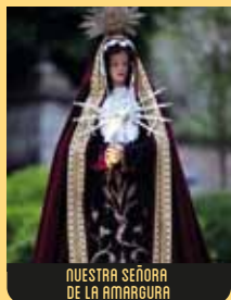
NUESTRA SEÑORA DE LA AMARGURA

Esta talla del siglo XVII pertenece a la Escuela de Pedro de Mena, y su pelo es natural. La figura, de armazón, vestida de terciopelo granate, porta la Cruz a sus espaldas. Se conserva en la Iglesia de la Venerable Orden Tercera.