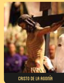
CRISTO DE LA AGONÍA

Obra del escultor contemporáneo Francisco Escudero, esta imagen de armazón representa el dolor de la Virgen ante el sufrimiento del Hijo. Se conserva en la Iglesia de San Jorge.