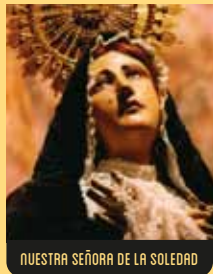
NUESTRA SEÑORA DE LA SOLEDAD

Representa a la Virgen y San Juan orando a los pies del Cristo crucificado. Con la misma procedencia y datación que los dos pasos anteriores, es el paso más pesado de San Jorge.