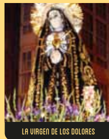
LA VIRGEN DE LOS DOLORES

Talla en madera policromada, data de 1809 y representa a la Madre de Jesucristo Doliente, con siete puñales clavados en el corazón, que simbolizan sus Siete Dolores. La imagen se conserva en la Iglesia de San Nicolás.