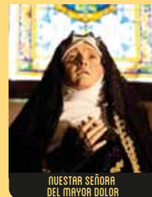
NUESTRA SEÑORA DEL MAYOR DOLOR

Esta talla policromada del siglo XIX y autor anónimo, se conserva en la Iglesia de la Venerable Orden Tercera, y representa el Dolor de la Virgen, con su corazón traspasado por siete puñales. La vallosa vestimenta está bordada en oro y data también del XIX.