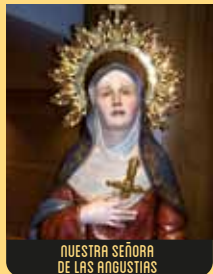
NUESTRA SEÑORA DE LAS ANGIUSTIAS

Jesús con la cruz a cuestas camino del calvario. Pertenece a la Iglesia de San Nicolás, este grupo procesional representa a Jesucristo cargando la Cruz con ayuda de José de Arimatea, bajo la vigilancia de los soldados romanos. La talla más destacada es el Nazareno, en madera policromada y vestida. La imagen fue móvil en los tiempos en que se escenificaban los pasos. Curiosamente, la figura tiene clavos en las manos, quizás preparado para cambiar de postura y aparecer en escenas posteriores de la Pasión.