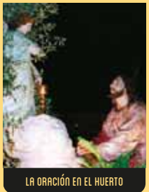
LA ORACIÓN EN EL HUERTO

Representando a Cristo en su sepulcro, es la figura principal de la procesión. De estilo romántico, es obra del coruñés Antonio Vidal, maestro de modelado del Real Consulado de A Coruña, en 1860. Su urna la fabricó el platero Joaquín de Angueira siguiendo un diseño de Juan Villamil y el propio Vidal. Todo el conjunto pertenece a la Iglesia de la Orden Tercera. Paso asignado a la Jefatura Superior de la Policía de Galicia.