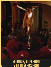
EL AMOR, EL PERDÓN Y LA MISERICORDIA